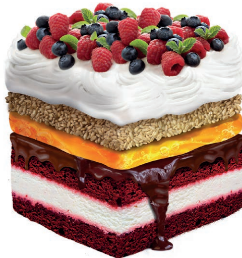
Key Visual der Business Unit IMPAG Nutrition & Health

Im Fokusbericht erläutern wir, wie Sie mit den verschiedensten farbgebenden Produkten Ihre Produkte in frischen Farben erstrahlen lassen. Wir freuen uns sehr, Ihnen die Produktpaletten für die verschiedenen Anwendungsgebiete zu präsentieren.